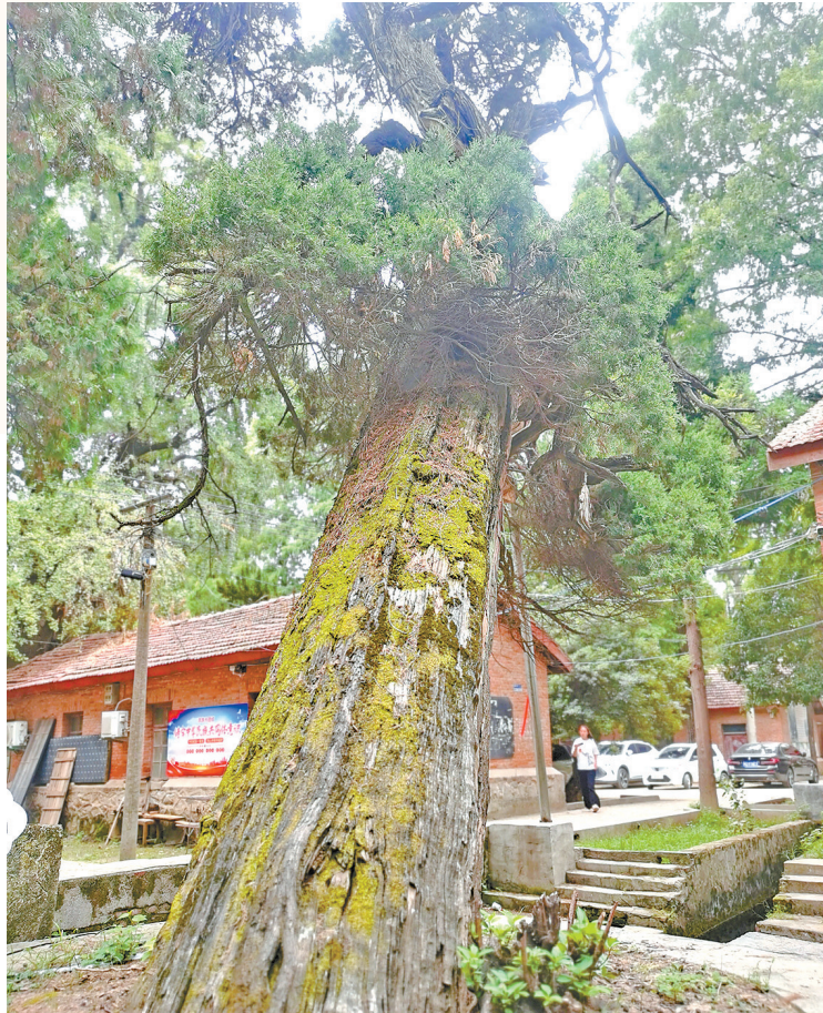
千年柏树见证沧桑巨变。⑥3

传说1400多年前，有高僧沿老乐山麓寻访，意在择一处适宜的场所修建寺院。多日跋涉后，他行至老乐山与秀岭之间的山谷，见此处地势开阔、环境清幽，正是适宜建设道场的所在。 确山古称朗陵。古朗陵县城西自南而北有三泉，名为南泉、中泉、北泉，泉前皆有寺院。位于北泉的寺院就是北泉寺，其古刹巍峨，清泉喷涌，古树掩映，风景绝佳。 北泉寺历经战火，如今仍留存着4株1400多年树龄的银杏树、2株1300多年树龄的柏树等珍贵古树，它们是这片土地历史变迁的鲜活见证。 “澄潭印月空不著，闲云照影寂无声。”穿越历史烟雨，布满青苔的碑刻文字与北泉寺融合在一起，组成奇妙的乐章，伴随着八卦九曲池静静流淌的泉水一起成为历史与人文的绝唱。