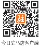
今日驻马店客户端