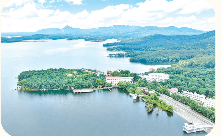
湖光山色 风景如画

近年来,泌阳县铜山湖风景区经过系统生态治理,生态底色愈发鲜亮。如今,该景区湖清林茂、生物多样,2016年获评国家4A级景区,形成生态保护、研学休闲融合发展格局,成为生态旅游示范地。