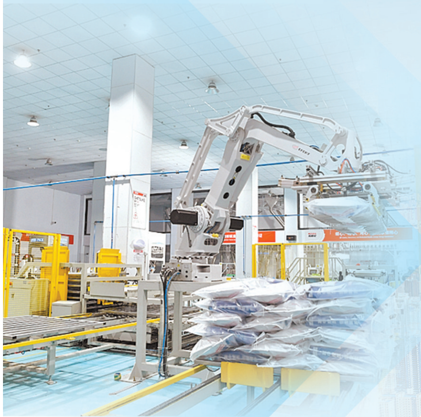
河南宠世纪宠物搭载顶尖智能生产线,生产高效快捷。⑥5

春去夏来,万物繁盛;草木葱茏,生机正浓。 在经济开发区,发展的脉搏正强劲跳动。 在这里,一粒玉米的旅程,早已不是收进仓库。它被深度“解码”,化身19种高附加值产品,身价跃升5倍至10倍; 在这里,一朵玫瑰的命运,也不再只是花开花落。从沾满露珠的田间到数据奔涌的云端,它被一条完整的芳香产业链托举,香气飘向更远的地方; 还是在这里,一袋宠粮从原料进厂到成品下线,全程智能化率超99%。车间里鲜见人影,产品却已漂洋过海,成为海外宠物碗里的“驻马店味道”…… 近年来,经济开发区深入学习贯彻习近平总书记河南考察时重要讲话精神,聚焦“1+2+4+N”目标任务体系,认真落实市委、市政府部署要求,以建设中国(驻马店)国际农产品加工产业园为抓手,充分发挥产业园区主阵地、主战场、主引擎作用,持续稳一产、强二产、扩三产,一幅产业聚势、向“新”而行、万物竞茂的画卷正在天中大地上徐徐展开。