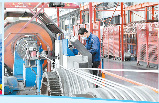
河南乐山电缆生产车间一角。⑥5