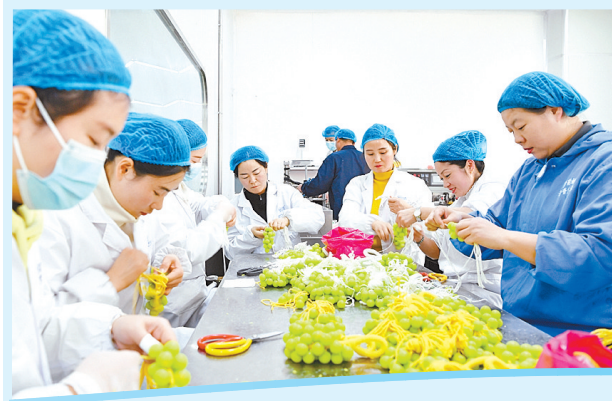
河南杞乐生物赋能驻马店玫瑰,打造全链条芳香产业。⑥5

项目为王的战鼓越擂越响,产业承载力实现质的飞跃,这正是经济开发区在产业园区高质量发展征程上最硬核、最动人的节拍。