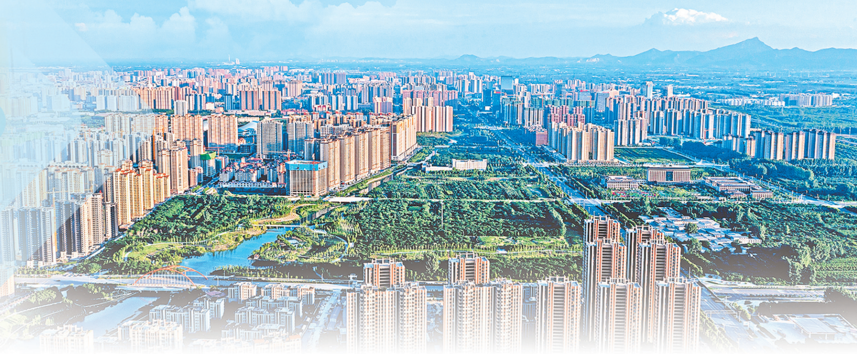
高楼林立、绿带环绕,经济开发区尽显产城融合新貌。⑥5