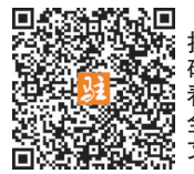
(据新华社北京4月18日电)