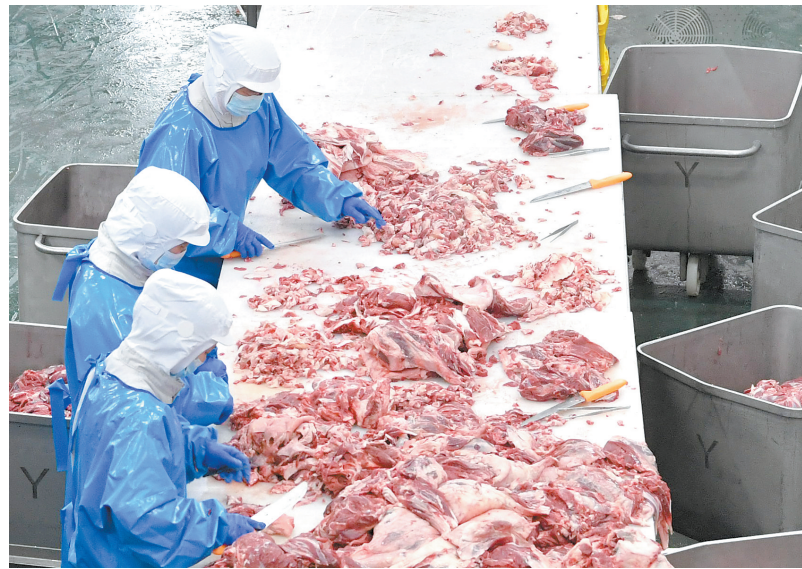
工人正在进行精细分割。③