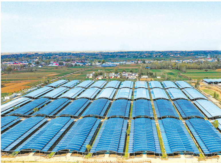
企业养殖区常年存栏肉牛2600多头。⑥3