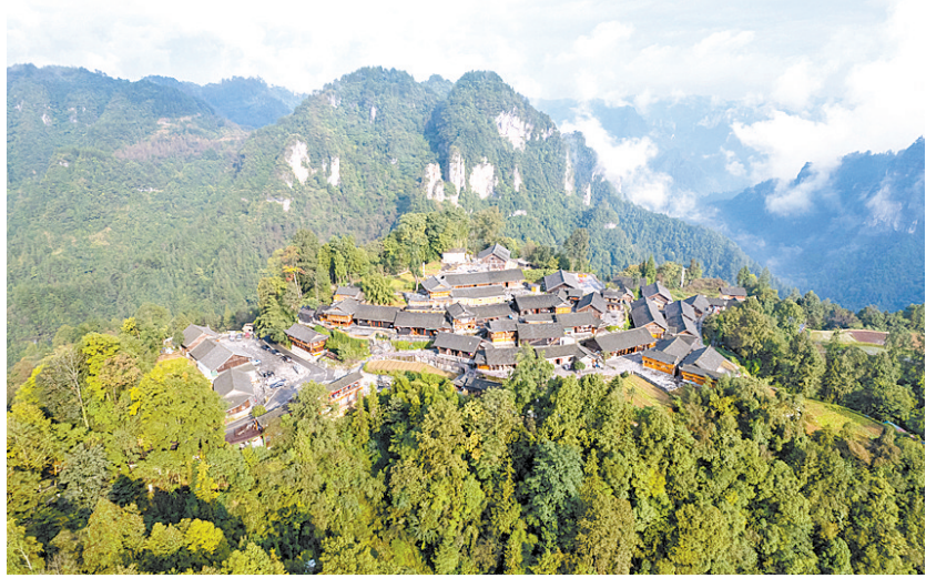
2023年10月10日拍摄的湖南省湘西土家族苗族自治州花垣县十八洞村景色(无人机照片)。

独特的山、水、林、田、溪、洞等自然资源,被十八洞村转化成可供游客观赏和体验的旅游产品,为农民带来更多收入。当地还修缮苗族古民居,修葺古驿道,增设苗族文化体验业态……透过十八洞村,世界看到了中国乡村振兴新图景。 大名鼎鼎的小岗村,更是中国农村改革的主要发源地。 在乡村旅游发展过程中,小岗村大力发掘在地资源,活化利用凤阳花鼓和凤画等非遗资源,建立大包干纪念馆等展馆,因地制宜推动文化和旅游融合发展。改革开放精神融入发展血脉,小岗村彰显着当代中国乡村的精气神。 越来越多乡村令人神往。文化和旅游部数据中心乡村旅游分中心监测数据显示,2024年前三季度,全国乡村旅游接待人次为22.48亿,同比增加15.5%;接待总收入为1.32万亿,同比增加9.8%。