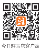
今日驻马店客户端