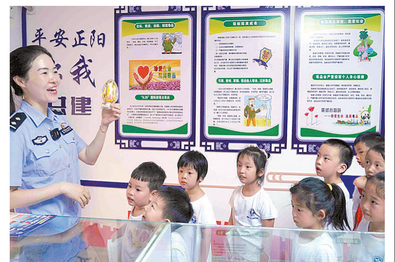
为进一步强化暑假青少年毒品预防教育工作,引导学生主动学习禁毒知识,远离毒品侵害,7月23日,正阳县公安局组织30多名小学生到该县禁毒教育警示基地参观学习。⑥3