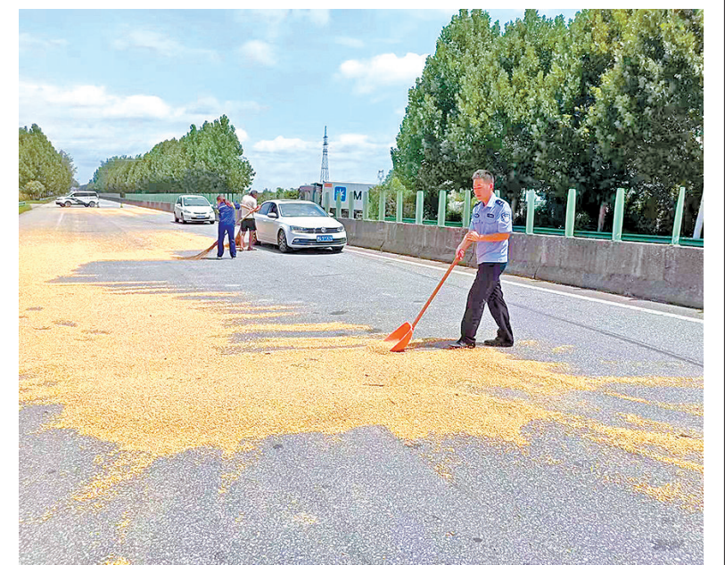
近日,在107国道西平县二郎镇路段,一辆满载玉米的货车发生侧翻。办案经过的西平县公安局二郎派出所民警看到后及时救援,帮助货车司机安全脱困并疏导交通。⑥3

用与滥用现象。同时,通过评估预算执行效果,分析预算资金使用效率和项目完成质量,为后续预算安排提供数据支持。 “通过专项审计,我们不仅要当好政府资金的‘守护者’,更要成为提高政府行政效能的‘促进者’。”该局主要负责人表示,“此次审计工作审计结果将作为优化财政资源配置、加强预算管理的重要依据,为平舆县政府在未来实施更为严谨的财政政策提供了坚实基础。”⑤2