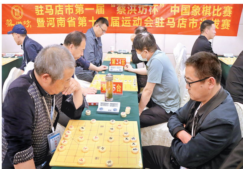
近日,由棋牌协会、驿城区象棋协会、河南蔡洪坊酒业有限公司、维也纳国际酒店共同举办的2023年驻马店市第一届“蔡洪坊杯”中国象棋比赛暨河南省第十四届运动会驻马店市选拔赛开赛。 此次比赛,不仅为棋艺爱好者提供了一个展示自我的机会,还搭建了一个互相学习、互相沟通的平台,加深了棋友间的友谊,活跃了群众的文化生活。⑥5

清楚、预案完善、指挥有序、保障有力的特点,但也存在情景预想还不足、各参演单位协同还不够、应急防范物资储备有待加强等问题。 李全喜要求,各相关单位要提高认识,加强预警,时刻紧绷安全这根弦,做好防大汛、抢大险、救大灾的准备;各相关单位要抓紧完善应急预案和抢险方案,扎实开展隐患排查整治,超前制定各项应对措施,提前储备抢险物资和相关装备;夯实责任,强化管理。各相关单位要严格履行城市抢险责任,确保人员到岗、责任上肩、措施落地,严格执行领导带班制度,实施24小时值班,全力打赢城市防汛这场硬仗。②7