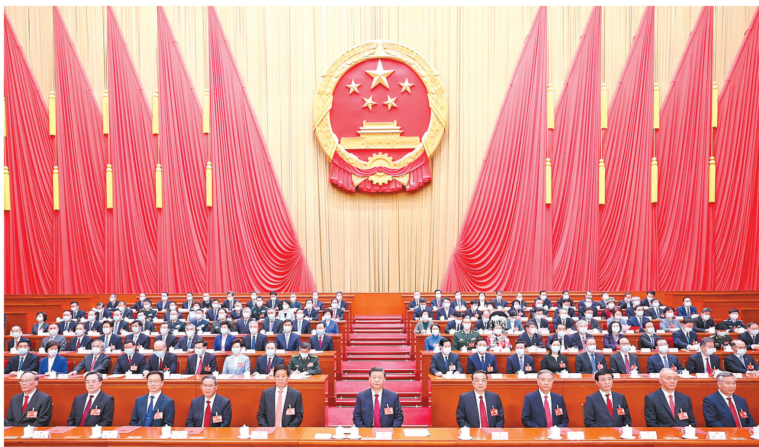
3月13日,第十四届全国人民代表大会第一次会议在北京人民大会堂闭幕。习近平等党和国家领导人在主席台就座。

新华社北京3月13日电 中华人民共和国第十四届全国人民代表大会第一次会议,在圆满完成各项议程,产生新一届国家机构组成人员后,13日上午在北京人民大会堂闭幕。