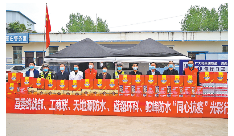
爱心企业助力疫情防控。