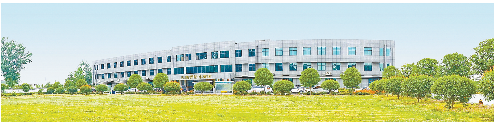
优美宽阔的办公厂区。