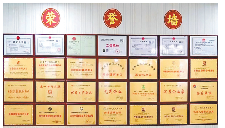
公司荣誉证书奖牌展示。