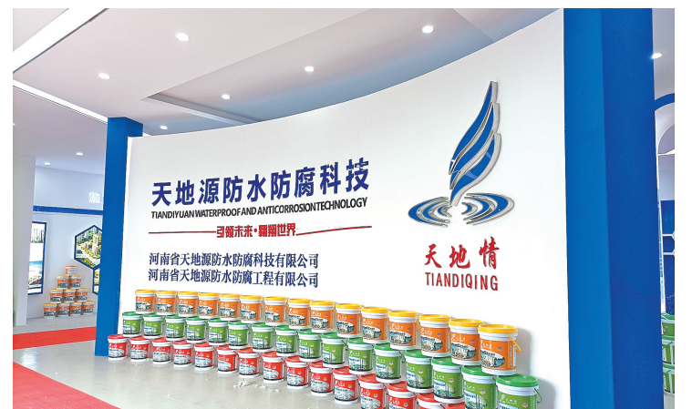
防水产品品类展示。