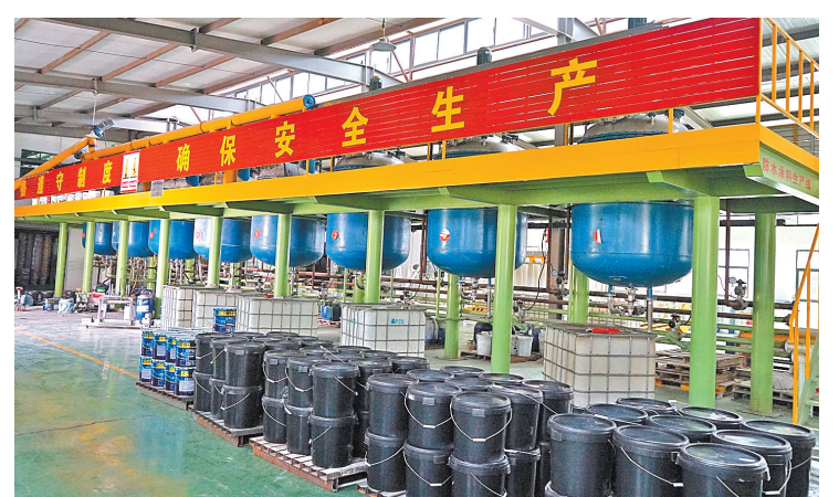
生产车间整洁有序。