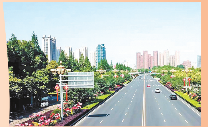
置地大道两侧林荫路。