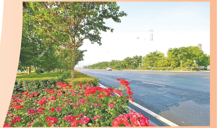
兴业大道绿化带花团锦簇。