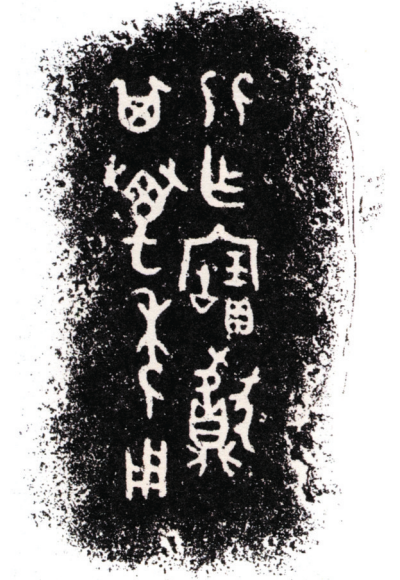
比甗铭。释文：比作宝甗，其万年用。

因比干后人迁居而得名的比水，是以国为姓的比氏后人的根脉所在，也是今日泌阳历史文化标识。明代泌阳进士陈民志文有《暮春游泌水》诗：“城南春尽见飞花，细草平沙一望赊。近水云霞催海势，隔邻烟火野人家。桥边柳色流莺啭，郭外钟声古寺斜。吏隐偶从休浣得，马蹄何惜踏青沙。”泌阳举人焦希程《赠张少鹤少府》诗中，也有“即看干仞朝翔去，泚水长留蔽帝春”之句。③2