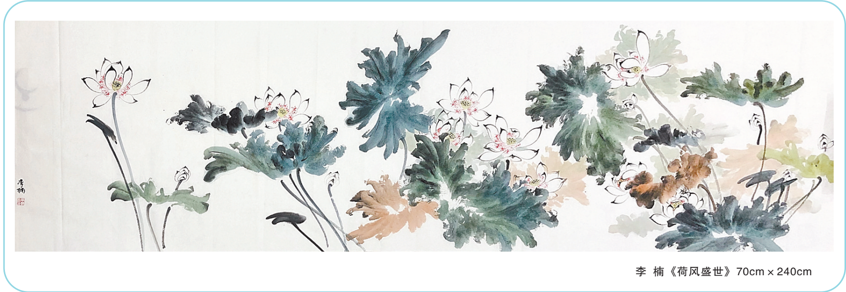
李楠《荷风盛世》70cm x 240cm