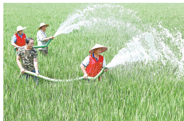
8月23日,在浙江省湖州市德清县新安镇舍东村,党员志愿者帮助村民抽水灌溉稻田。近来,为应对旱情,各地动员组织各方力量积极投入抗旱保民生工作中,全力保障群众饮水安全和农业生产灌溉。