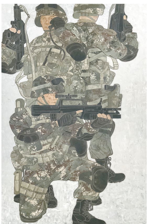
石占巍《卫士》200cm x 120cm