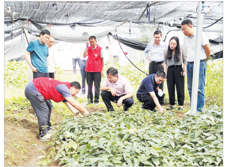
日前，省退役军人事务厅就业创业处相关负责人在市退役军人事务局和平舆县退役军人事务局等相关负责人的陪同下，到平舆县李屯镇洋董种植示范基地，开展专题调研座谈和项目考察。调研组一行查看了基地育苗、种植项目等，观看了企业宣传专题片。省、市退役军人事务部门有关人员就该基地参加退役军人创业大赛与该基地负责人进行了探讨，并提出了指导建议，就如何扶持该基地发展作出规划。□7

时代是出卷人，我们是答卷人，人民是阅卷人。以“党建带群建、群建促党建、党群一体化”为总体思路的“党建+”服务残疾人新模式，是市残联以真抓实干、勇于担当向广大人民群众交出的残疾人工作高质量发展的亮眼答卷。□10