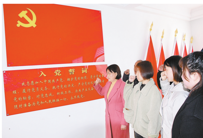
为建设政治过硬、作风过硬的干部队伍,近日,西平县二郎镇小王庄村“两委”班子成员,重温入党誓词,激发乡村振兴的内生动力。②9