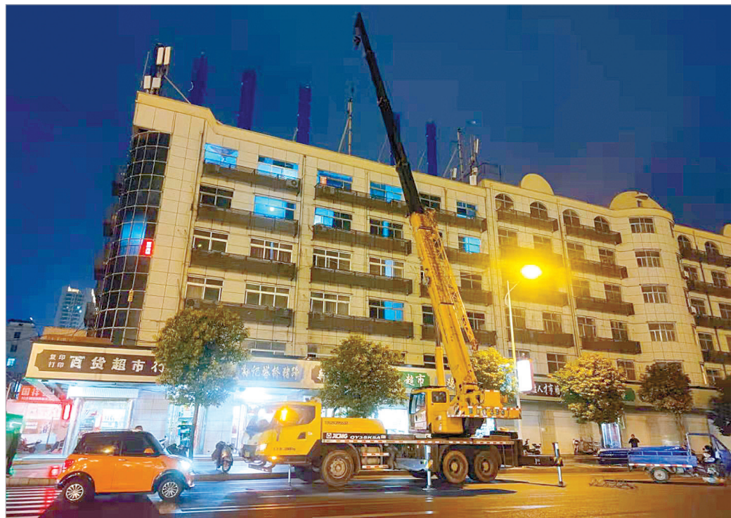
执法人员对位于市木兰街与菜市街交叉口路北一酒店楼顶违规广告牌进行拆除。⑫2

3月5日，驻马店火车站广场西侧，市城市管理行政执法支队组织执法人员对违规设置的楼顶广告牌进行拆除。据了解，火车站广场周边共有三处大型户外广告牌，因历史原因未取得行政设置许可，属违规设置，市民多次反映大型户外广告牌存在安全隐患。为进一步净化火车站周边环境，消除安全隐患，市城市管理行政执法支队对上述违规广告牌进行了拆除。