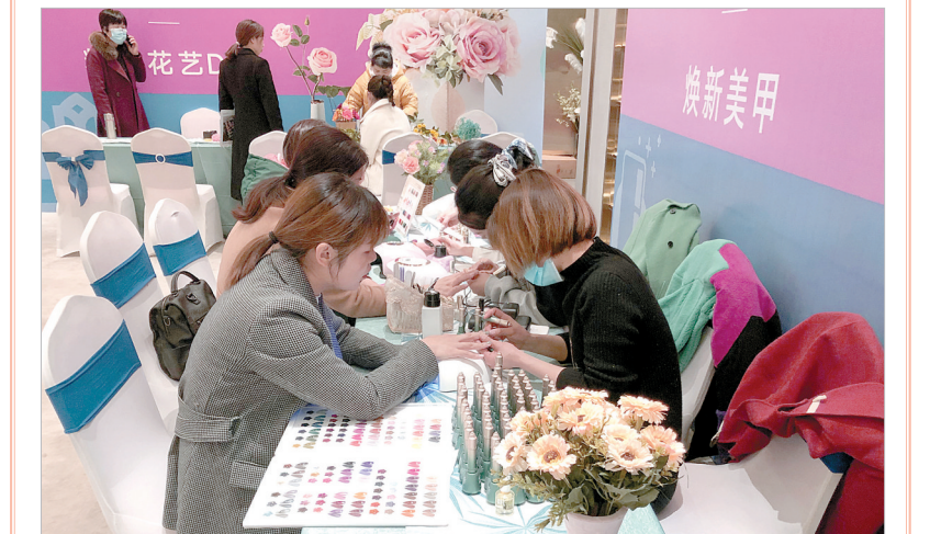
一双十指玉纤纤，不是风流物不粘。爱美之心人皆有之，给指甲做个美容，纤纤玉指魅力无限。⑫2

活动期间，建业·滨河珑府为女业主安排了“幸运大抽奖”环节。抽奖时刻，整个营销中心热闹非凡，大家热情参与，现场气氛不断升温。“幸运大抽奖”活动奖品十分丰富，有精品小推车、品牌抽纸、建业绿色基地有机大米等。⑫10