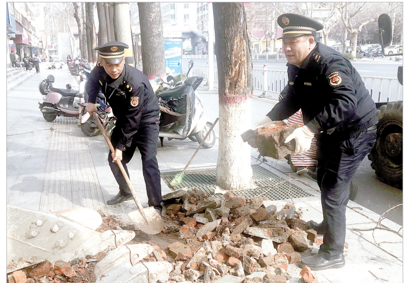
执法人员对私搭乱建斜坡进行拆除。⑫2

泥搭建斜坡4处。该局执法负责人说：“这些斜坡主要是商家为了卸货方便而搭建的，不仅影响街道的整体美观，还严重影响了市第十一小学和市第二初级中学学生的安全出行，学生放学后经常被斜坡绊倒，我们今天进行斜坡拆除，也是还路于民。今后，驿城区城管局执法大队将加大日常监管和巡查力度，严查和取缔占道经营、私搭乱建等与文明城市格格不入的行为。同时，他也呼吁商户和市民要从自身做起，杜绝私搭乱建等违章违法行为，美化辖区环境，提升文明城市形象。”执法负责人介绍道。⑫10