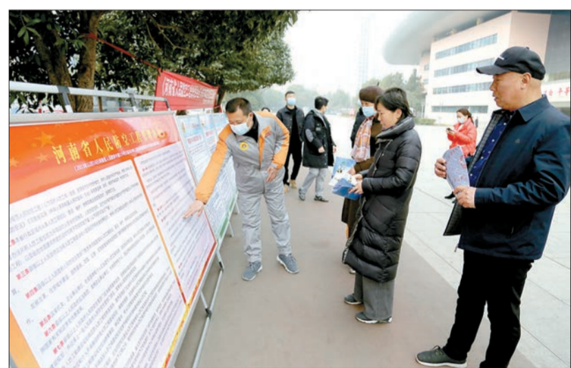
《河南省人民防空工程管理办法》宣传日当天,市民在宣传展板前驻足观看,学习有关防空安全条例。②2