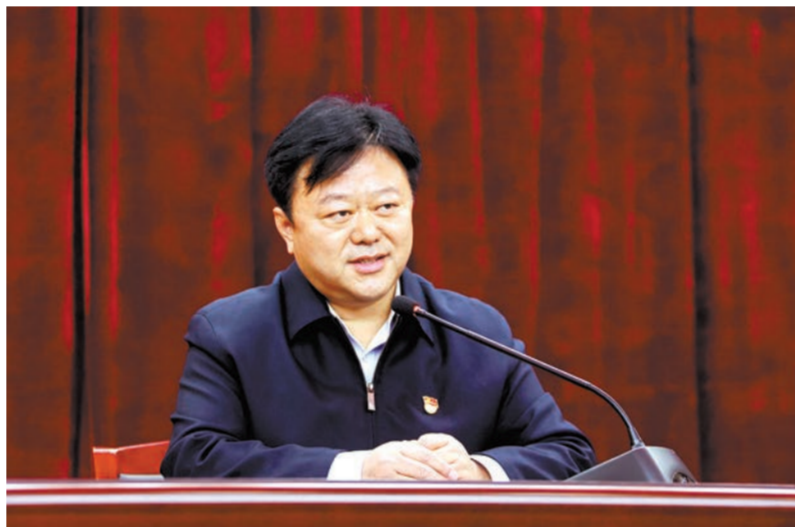
市委书记陈星到驻马店职业技术学院上思政课，宣讲党的十九届五中全会精神。②9

八面来风，四方接壤。承载着驻马店人民对高等职业教育的期盼，肩负着办好人民满意的教育使命，驻马店职业技术学院植根沃土、踏歌而行！