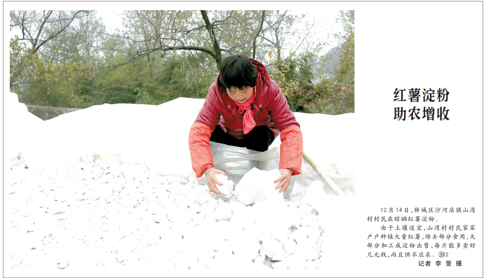
红薯淀粉 助农增收

12月14日，驿城区沙河镇山湾村村民在晾晒红薯淀粉。由于土壤适宜，山湾村村民家家户户种植大量红薯，除去部分食用，大部分加工成淀粉出售，每斤能多卖好几元钱，而且供不应求。②2