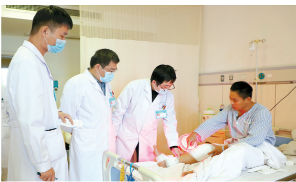
运动医学亚专科团队为患者诊疗。③/3

可期。该科负责人表示，下一步，市中心医院运动医学亚专科将在踝关节镜和髌关节镜上有所突破，为更多的患者提供更优质的服务。③/3