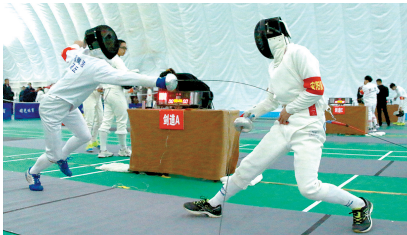
击剑场上激情四射。②/3